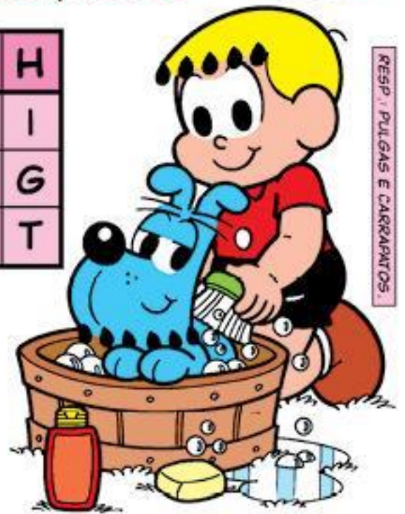
RESP.: PULGAS E CARAPINTOS